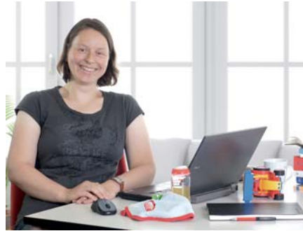
Vereinbarkeit Beruf & Familie