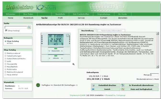
eShop bei Unielektro